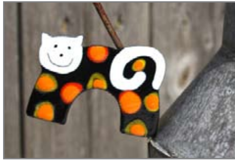
Brosch Best. nr. 112 Brosch djurmotiv. Handmålat i emalj.