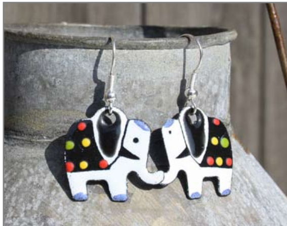
Örhängen Best. nr. 057 Örhängen djurmotiv. Handmålat i emalj. Nickelfritt.